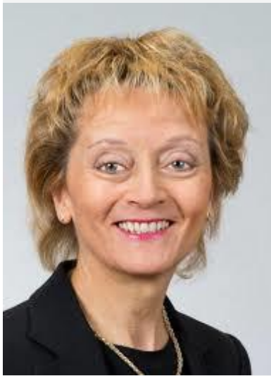
Eveline Widmer-Schlumpf en 2012