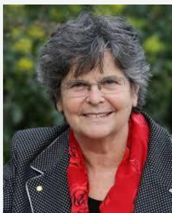
Ruth Dreifuss en 1999