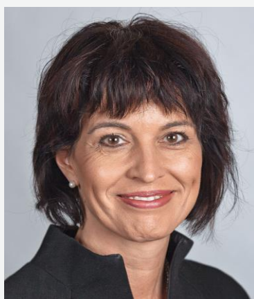
Doris Leuthard en 2010 et 2017