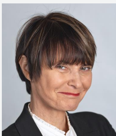
Micheline Calmy-Rey en 2007