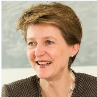
Simonetta Sommaruga en 2015