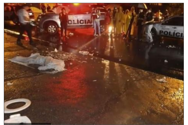
L'actu est reprise par YouTube... Et l'histoire aussi maintenant avec des chaînes ad hoc. Capture d'écran

L'histoire convoque de mauvais souvenirs de classe ? Oubliez tout. Le festival propose plein de nouvelles formes de récit. Florilège.