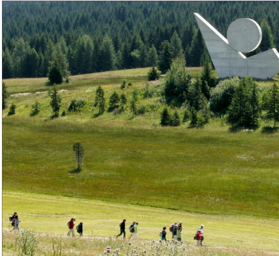
Samedi, trois historiens de la Résistance viendront parler des lieux emblématiques de mémoire de l'Ain et de la Haute-Savoie comme le plateau des Glières... Rare à Genève, où cette histoire est largement méconnue.

Thème de cette troisième ? La liberté. Un hommage au 50 e anniversaire de mai 68 évidemment. Et plus généralement d'ailleurs à l'émancipation générale de cette année-là que l'on a souvent tendance à réduire à un joli mois printanier en France. Mais comme l'histoire ne vaut que pour les leçons qu'elle apporte au présent, "Histoire et Cité" aborde également la liberté en raison des ambivalences de notre temps, aussi sécuritaire